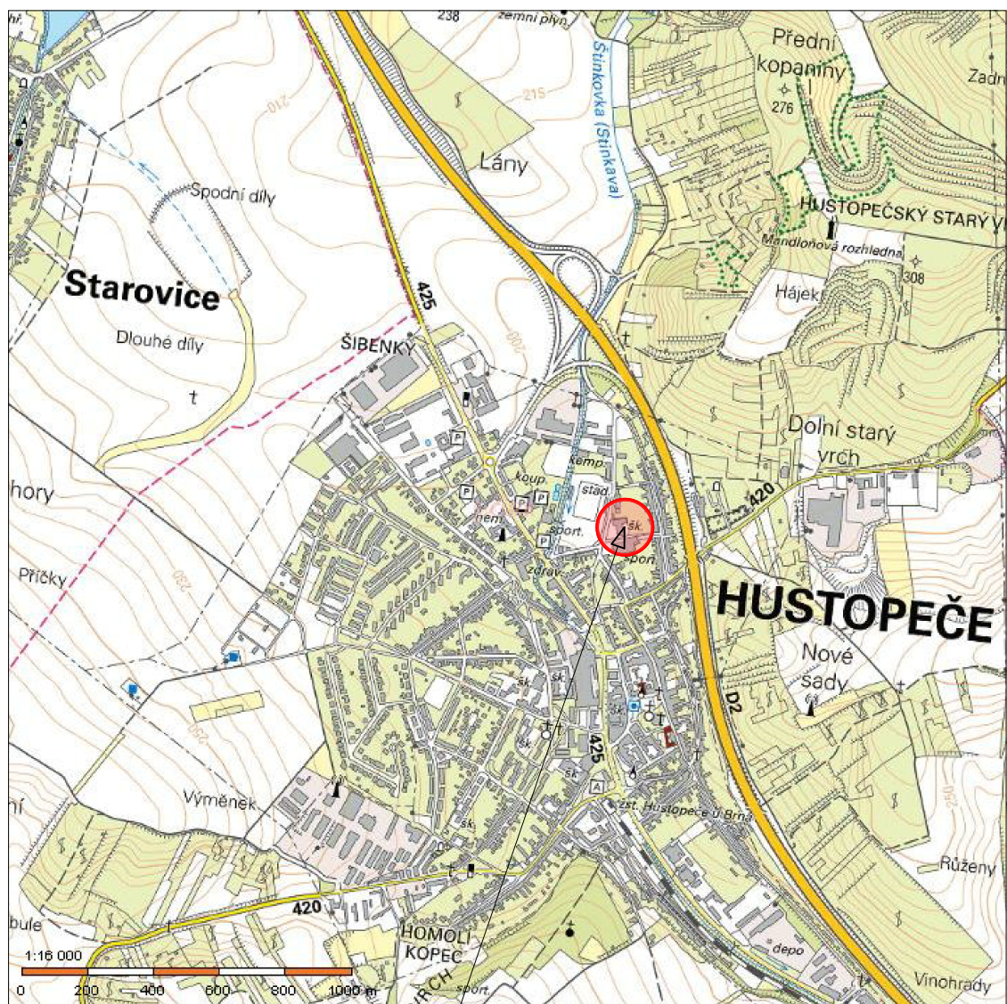
OBJEKT ZŠ a PŠ HUSTOPEČE - stavební úpravy pro ZUŠ

P.B.=192,470 (stávající poklop kanalizace před vstupem) +0,000 = ÚROVEŇ PODLAHY ŠKOLY +0,000 = 192,81 VÝŠKOVÝ SYSTÉM B.p.V.